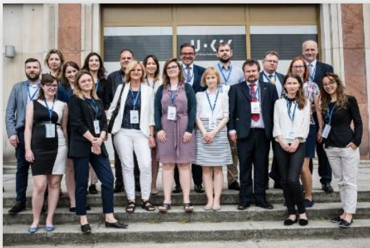
WIZYTA STUDYJNA W ECK PORTUGALIA