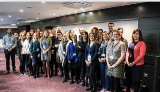
WARSZTATY KOMUNIKACYJNE ECC-NET W TALLINIE