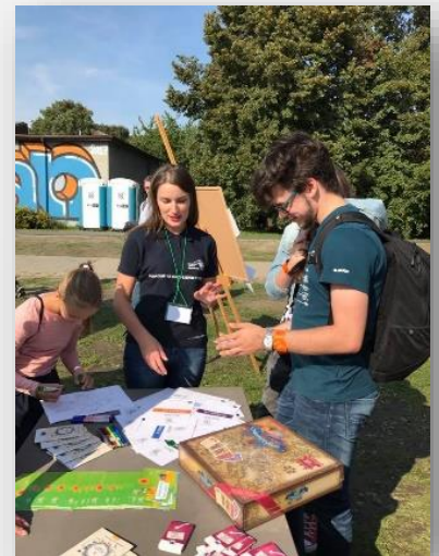
EUROPA ZMIENIA METROPOLIĘ WARSZAWSKĄ