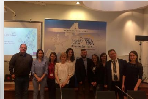
WIZYTA STUDYJNA ECK IRLANDIA I ECK BULGARIA W ECK POLSKA